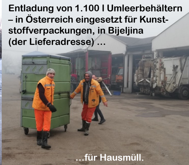
Entladung von 1.100 l Umleerbehältern – in Österreich eingesetzt für Kunststoffverpackungen, in Bijeljina (der Lieferadresse) ...