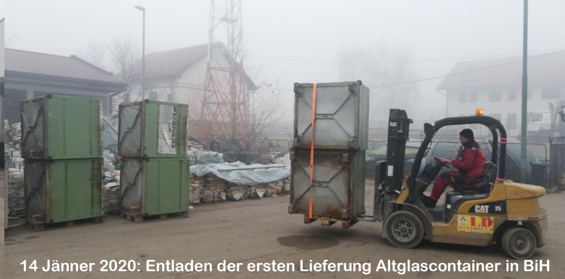
14 Jänner 2020: Entladen der ersten Lieferung Altglascontainer in BiH

Transfer von Gerät (second hand) und Know how (first class)