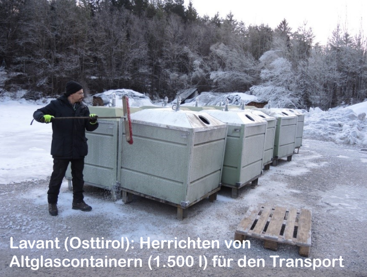
Lavant (Osttirol): Herrichten von Altglascontainern (1.500 l) für den Transport